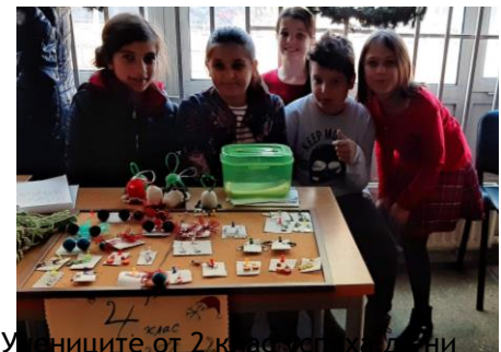
Учениците от 2 клас успяха да ни

отделят време и да ни разкажат за подготовката на коледния базар.